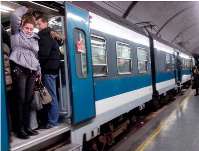
IL TRENO DEI DISPERATI ACCALCATI