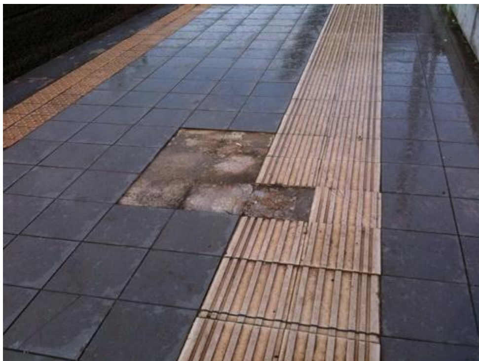
DANNEGGIAMENTI IN STAZIONE