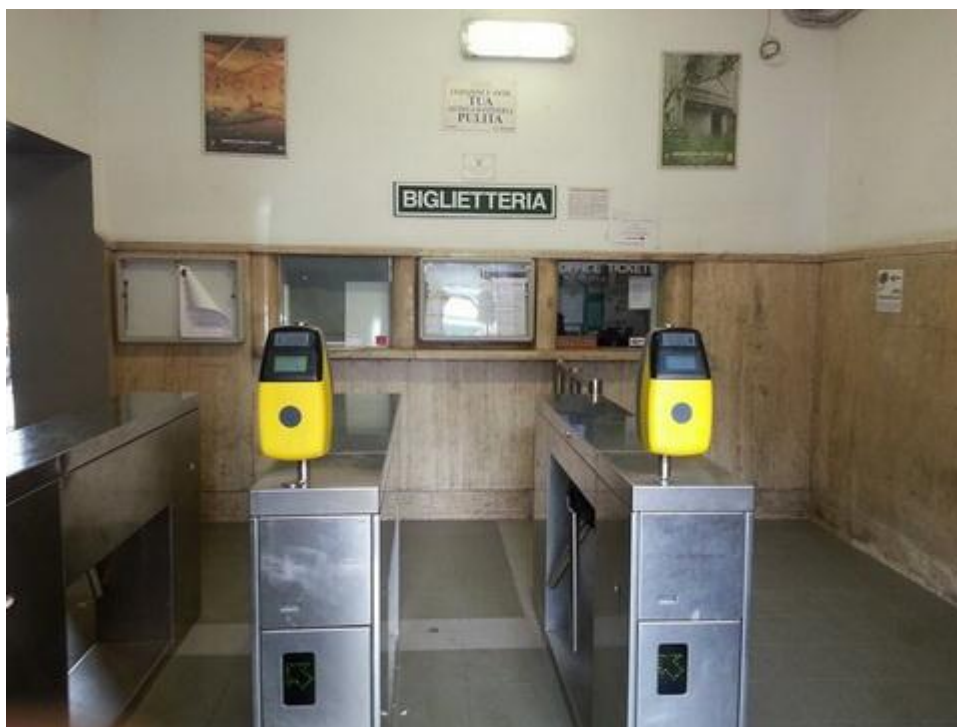
BIGLIETTERIA CHIUSA E TORNELLI APERTI - MORLUPO