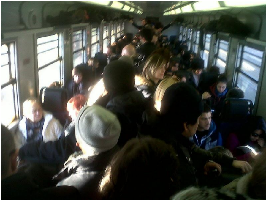
SOLITO AMMASSO DI CARNI SUL TRENO BESTIAME